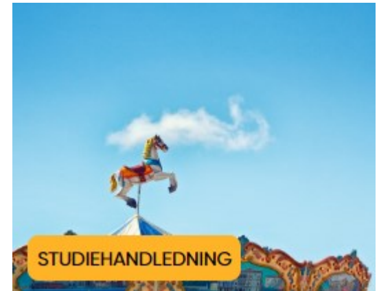
SH1 Jag som studerande (GLP 2016)