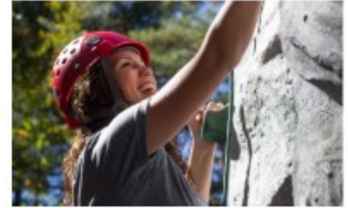
PS1 Psykisk aktivitet och lärande (GLP 2016)

https://www.studeo.fi/lukio/bruksanvisning/