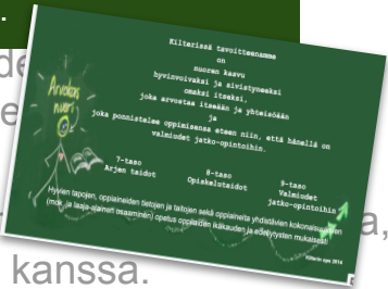
(Kilterin ops 2016)

Toimintakulttuurimme elämästä vastaa ja sitä toteuttaa koko kouluyhteisö. Toimintakulttuurin suunnittelemalla ja yhdessä tekemällä. Arvioimme toimintaamme yhdessä oppilaiden kanssa.